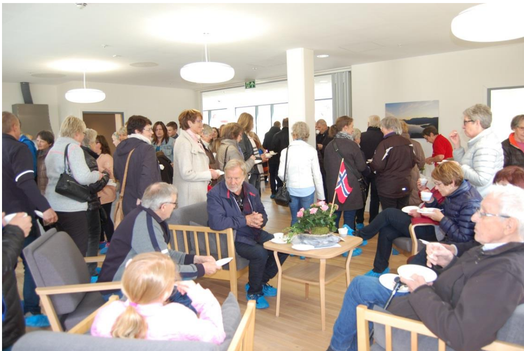
Det er plass til mange besøkjande. Her frå opningsdagen