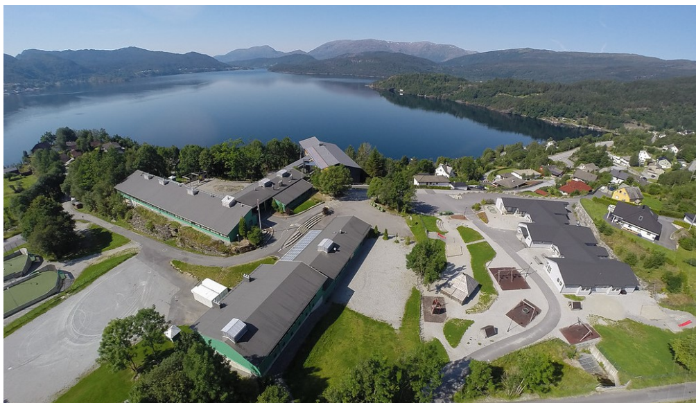
Samnanger barneskule og Dråpeslottet barnehage.

PPT må kunna jobba systemretta. Skulane treng hjelp med å organisera klassar og grupper, tidleg innsats og spesialundervisning på ein slik måte at elevane skal føla seg inkluderte. Det må vera eit samspel med PPT når det gjeld skulen sine rammer og trong for spesialundervisning for enkeltelevar. Ved å ha PPT tettare på dei ulike einingane, vil det vera lettare å tilpassa trongen for spesialundervisning inn mot grupper/klassar. Arbeid i lag med ressursteamet på skulen er ein viktig del av dette. I ressursteam skal rektor på skulen og spes.ped-leiar vera representerte i lag med PPT.