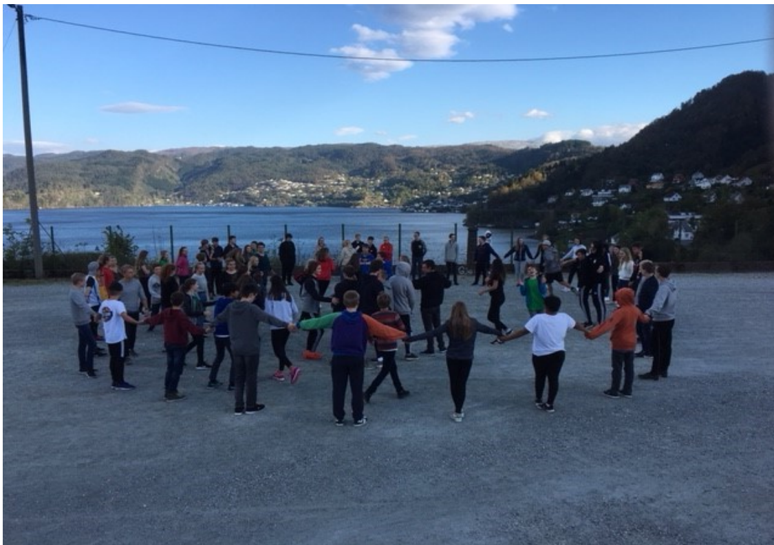
Markering av verdsdagen for psykisk helse Samnanger ungdomsskule.