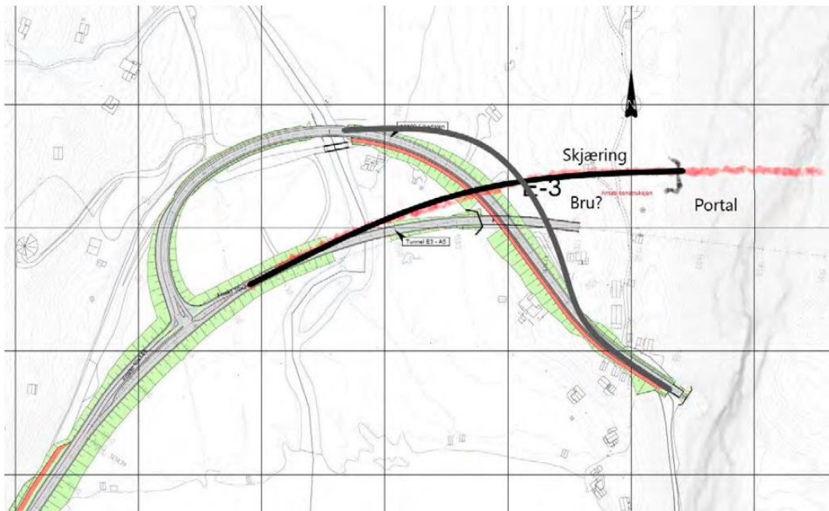
Figur 3: Endring av påhogg i Eikedalen. Svart linje viser alternativ plassering av ny veglinje for fv. 49. Lokalveg, vist med mørk grå linje, kan leggest på bru over ny fylkesveg i staden for over portal som planlagt i opprinneleg løysing.

Planomtalen har følgjande figur, som illustrerer endringane i Eikedalen E3. Endringane har berre konsekvensar i Kvam herad: